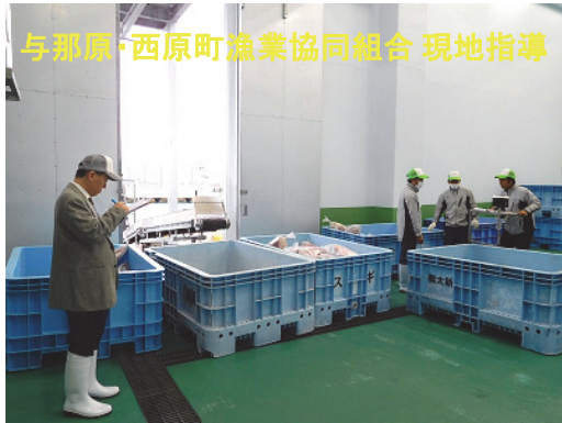
与那原・西原町漁業協同組合 現地指導