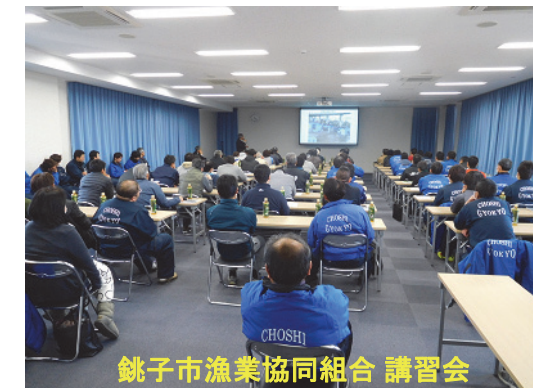
鮫子市漁業協同組合 講習会