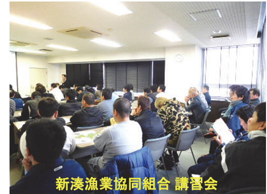
新湊漁業協同組合 講習会

HACCP認定加速化支援センター(代表機関:一般社団法人大日本水産会) 構成機関 一般社団法人海洋水産システム協会 ●…産地関係者(市場関係者)を対象とした講習会・研修会(定額) ★…産地関係者(市場関係者)を対象とした現地指導(1/2補助)