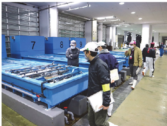
産地の品質・衛生管理現地指導の様子

この現地指導を活用して、産地における品質・衛生管理の徹底と向上を図り、安全・安心な水産物の流通促進に役立てていただければ幸甚です。